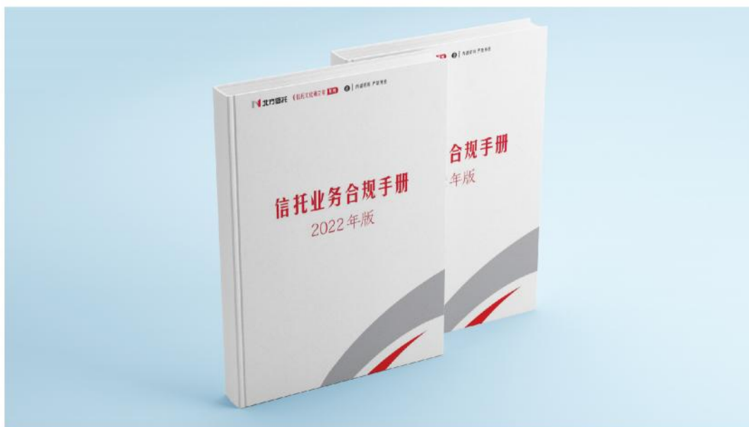
《信托业务合规手册（2022版）》

认真贯彻落实全国金融工作会议精神和监管工作要求，持续开展合规管理体系自查整改，不断强化合规建设。结合公司业务转型需要，编制印发《信托业务合规手册（2022版）》《经营活动制度汇编》，开展重点业务制度测评和6次专题培训。完成合规政策解读、最新监管政策分析等，引导全员及时了解掌握监管政策变化、调整展业思路。