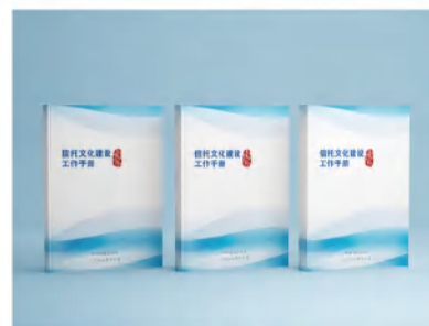
《信托文化建设工作手册》

围绕“信托文化确立年”,开展多维度、多样化的信托文化教育培训宣导,编制印发《信托文化建设工作手册》,组织开展金融知识答题、微视频制作、主题征文等活动,积极参与天津银保监局组织开展的“清廉金融文化线上访谈”活动,拍摄专题宣传片,引导全员树牢“信义、专业、勤勉、合规”价值理念和“守正、忠实、专业”受托文化,勤勉尽责履行受托人职责。报送作品《微茫不朽 - 献给每一份无私的坚守》被中国信托业协会评选为十佳优秀微视频。