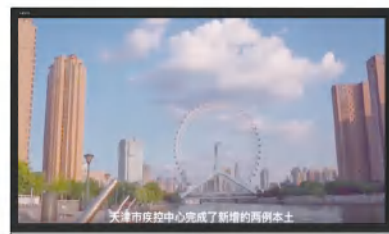
《微茫不朽 - 献给每一份无私的坚守》